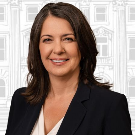
Honourable Danielle Smith, Premier of Alberta

A handwritten signature in black ink that reads "Danielle Smith".